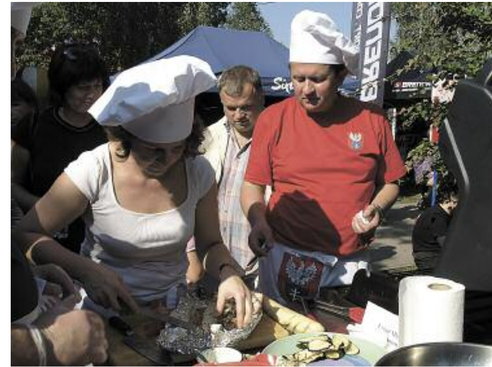
Drużyna urzędu miasta podczas I Legionowskiego Fish&Grill

W ubiegłym roku, żegnając reprezentację Grecji, robiliśmy wspólnie sałatkę, popularnie w Polsce nazywaną „grecką”, nota bene niekoniecznie znaną w kraju Homera. W tym roku wrócimy na rodzimy, kulinarny grunt i zaprosimy wszystkich do wspólnego