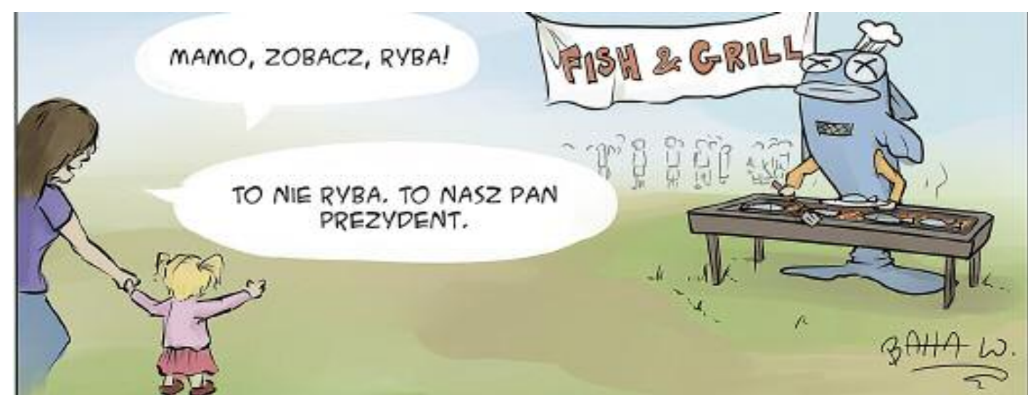
Prezydent miasta Legionowo również w tym roku pojawi się na Fish & Grill.