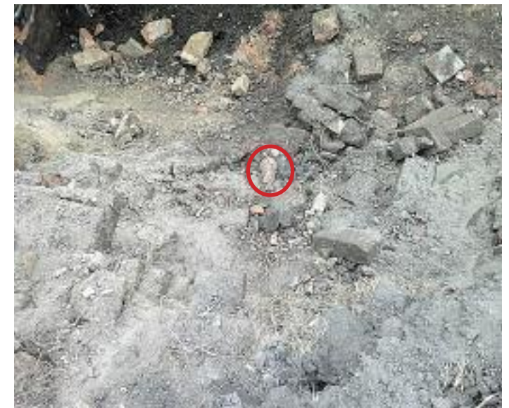
Według mieszkańców Osiedla Piaski, na budowie możemy znaleźć jeszcze wiele śladów wojny