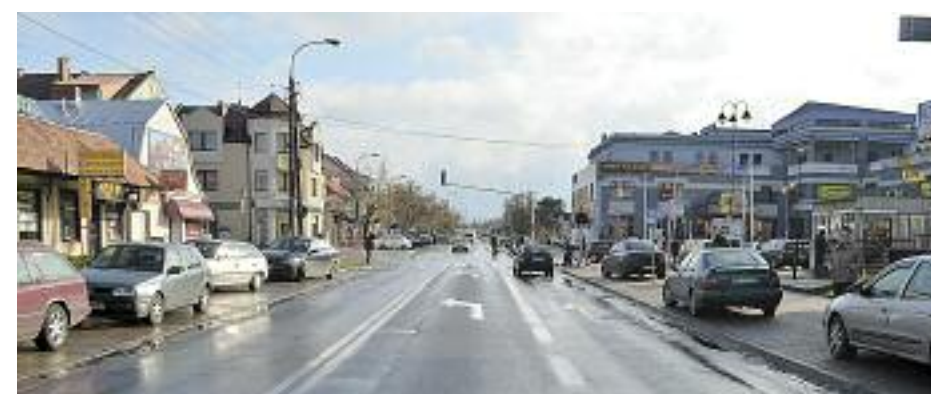
Od 1 lipca będzie zamknięte skrzyżowanie Piłsudskiego z Jagiellońską

6 czerwca poważnie ograniczono ruch kołowy na ulicach Sobieskiego i Krakowskiej w Legionowie. Utrudnienia związane są z remontem dróg powiatowych: Jagiellońskiej i Parkowej. To jednak nie jedyna niespodzianka jaką drogowcy szykują dla legionowskich kierowców. 1 lipca zamkną także skrzyżowanie Piłsudskiego z Jagiellońską.