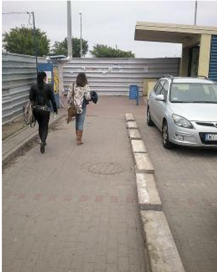
Dla większego bezpieczeństwa pieszych wytyczono tymczasowe ścieżki wzdłuż peronu i wyjść z przejścia podziemnego

Bez wątpienia budowa Centrum Komunikacyjnego jest jedną z najważniejszych inwestycji miasta w ostatnim czasie. Nie tylko stary barak zamienimy na Centrum Obsługi Pasażera z nowoczesną Mediateką, ale również przybędą nam miejsca parkingowe i wewnętrzna obwodnica miasta. Zanim jednak to się stanie, będziemy na bieżąco informować, jak przebiegają prace oraz co się dzieje w związku z budową. Zapraszamy do lektury pierwszego z cyklu, raportu z placu budowy.