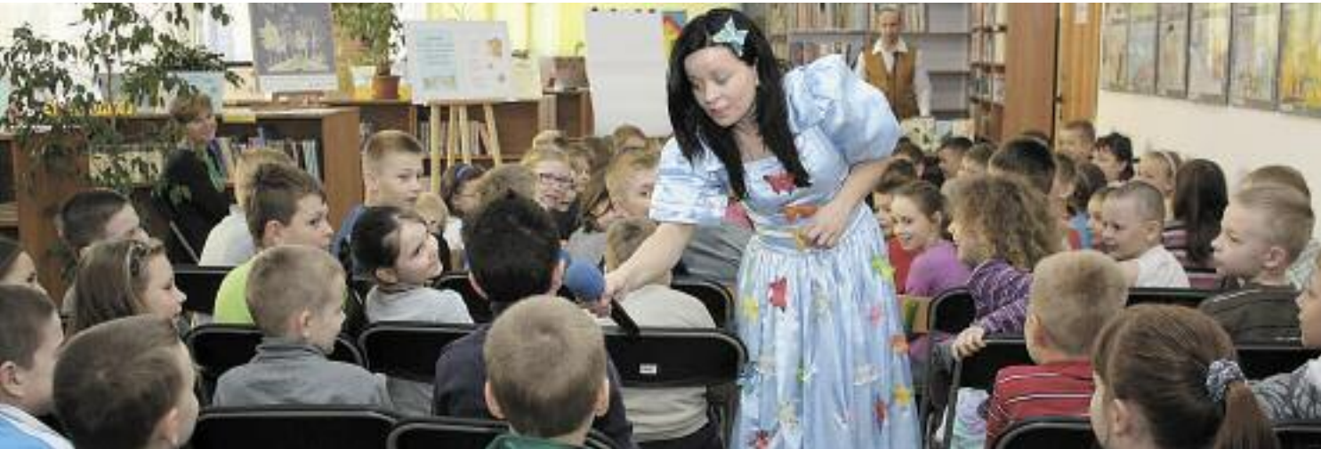
Wszystkie propozycje, a szczególnie te dla dzieci, cieszyły się dużą popularnością odwiedzających

Tydzień Bibliotek to ogólnopolska akcja promująca czytelnictwo i biblioteki organizowana od 2004 r. przez Stowarzyszenie Bibliotekarzy Polskich. W tym roku odbyła się w dniach 7–15 maja. Legionowska Biblioteka ponownie włączyła się w tę akcję, a różnorodną ofertę promującą książkę i czytanie rozszerzyła na dni od 7 do 16 maja. Święto to obfitowało w szereg wydarzeń w miejskiej księgarni, a szczególną uwagę warto zwrócić na następujące wydarzenia: