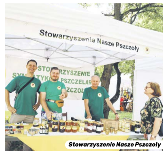
Stowarzyszenie Nasze Pszczoły

Legionowskie organizacje pozarządowe zaprezentowały swoje działania, cele oraz osiągnięcia. Wydarzeniu temu, już tradycyjnie, towarzyszyła akcja "Dogęszczamy zielenią", podczas której, w zamian za plastikowe nakrętki lub zużyte baterie, rozdawane były sadzonki drzew i krzewów.