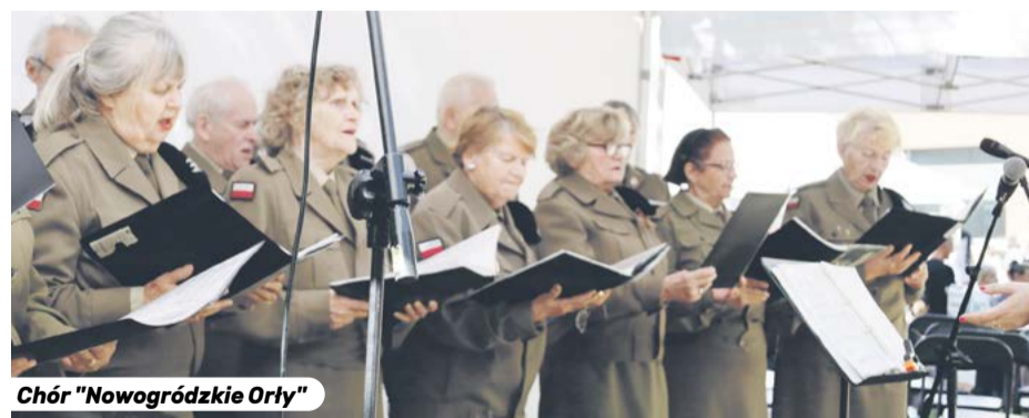
Chór "Nowogródzkie Orły"