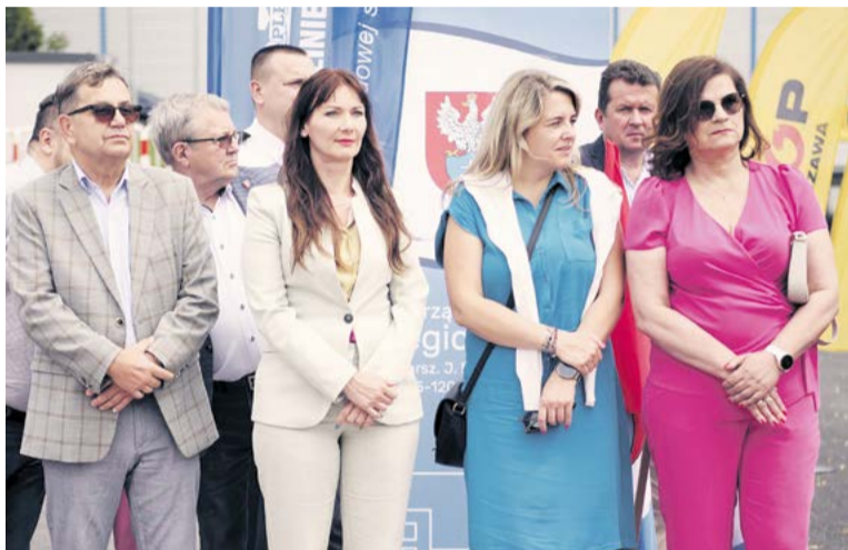
Otwarcie tunelu na Bukowcu