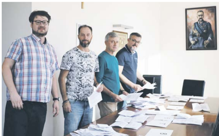
Zespół ds. Budżetu Obywatelskiego

Największą popularność wśród projektów zyskało zadanie dotyczące Nowoczesnej tablicy sportowej w Arenie Legionowo. Drugie miejsce wśród wybranych do realizacji projektów zajęła Pokój zabaw sensorycznych w Poczycalni. Na ostatnim miejscu podium uplasował się zaś projekt Ekologiczne Legionowo. Ostatnie zadanie, które zo-