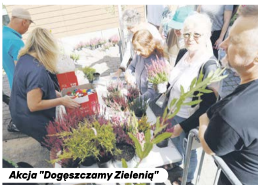
Akcja "Dogęszczamy Zielenią"