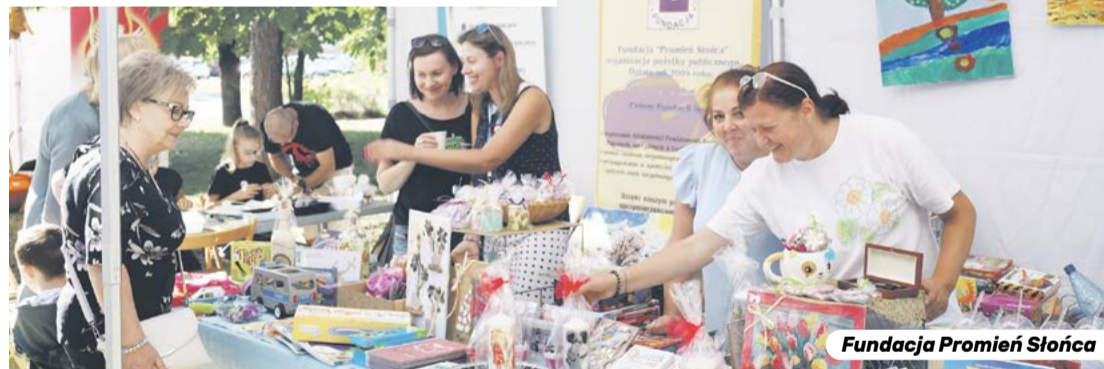
Fundacja Promień Słońca