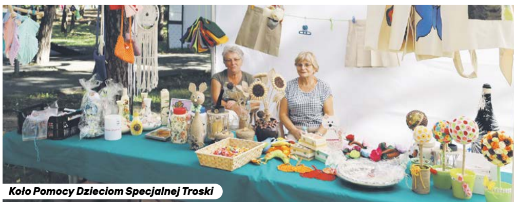
Koło Pomocy Dzieciom Specjalnej Troski