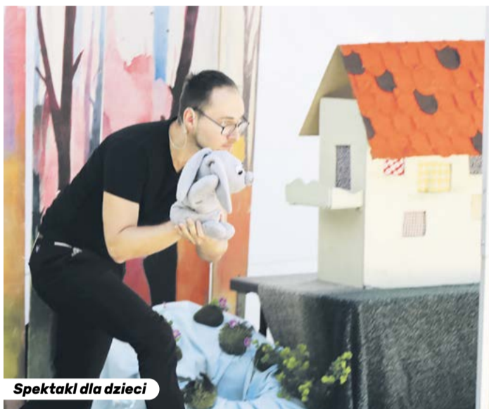
Spektakl dla dzieci