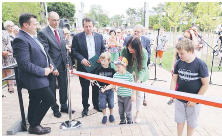
Otwarcie Ośrodka Pomocy Społecznej

Legionowo, który jest podwykonawcą MediTransu, stał się współorganizatorem ratownictwa medycznego w naszym regionie. Jesteśmy dużym obszarem, a nasze społeczeństwo starzeje się i dbałość o seniorów szczególnie leży mi na sercu. W tym kierunku chciałabym wspierać dalej