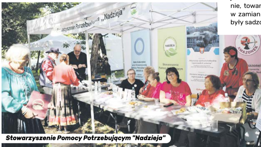
Stowarzyszenie Pomocy Potrzebującym "Nadzieja"