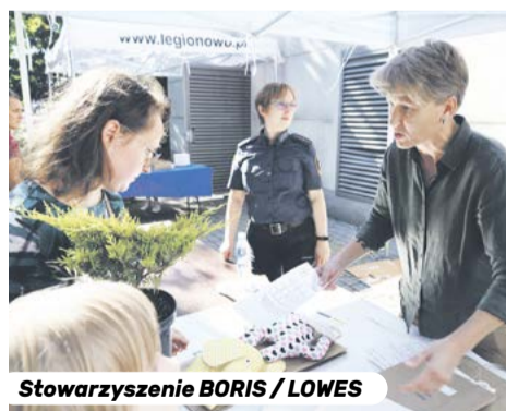
Stowarzyszenie BORIS / LOWES