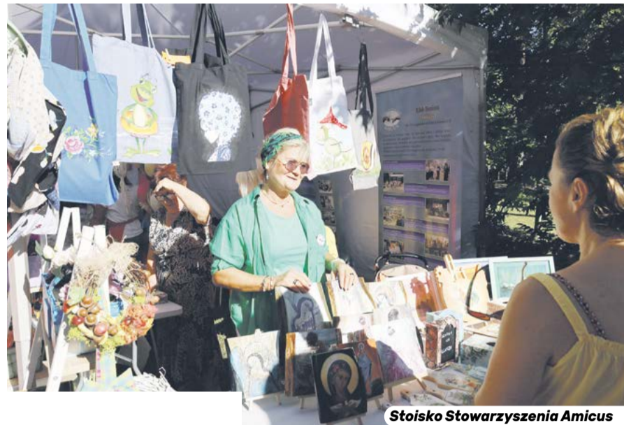
Stoisko Stowarzyszenia Amicus